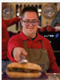
Bar Bistrot Anagramma