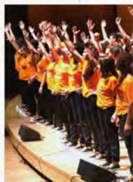
Coro di Oliver