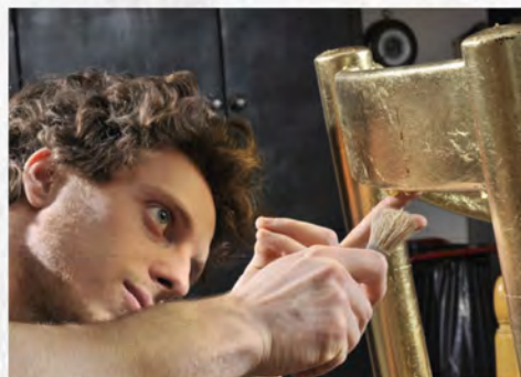
Contrada degli Artigiani